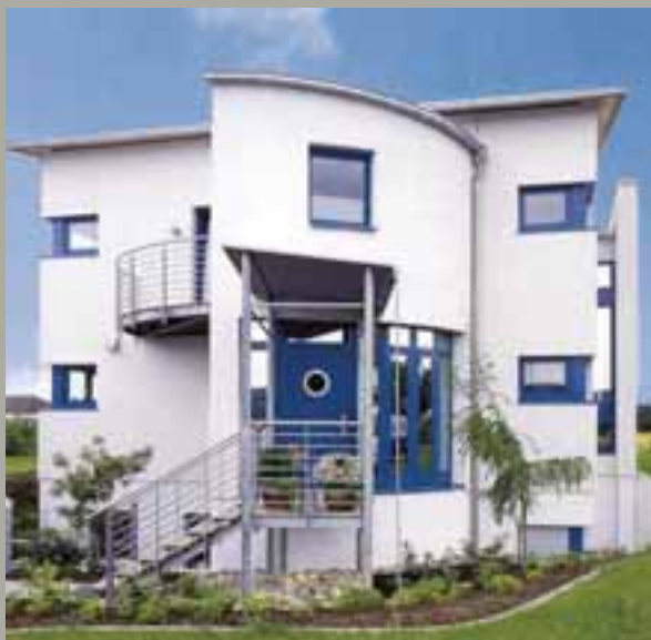
3L Architekten + Industriedesigner, Menden.